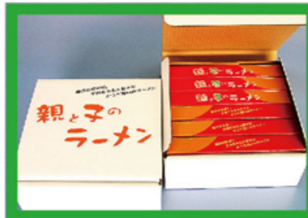
贈答セット(6箱タイプ)